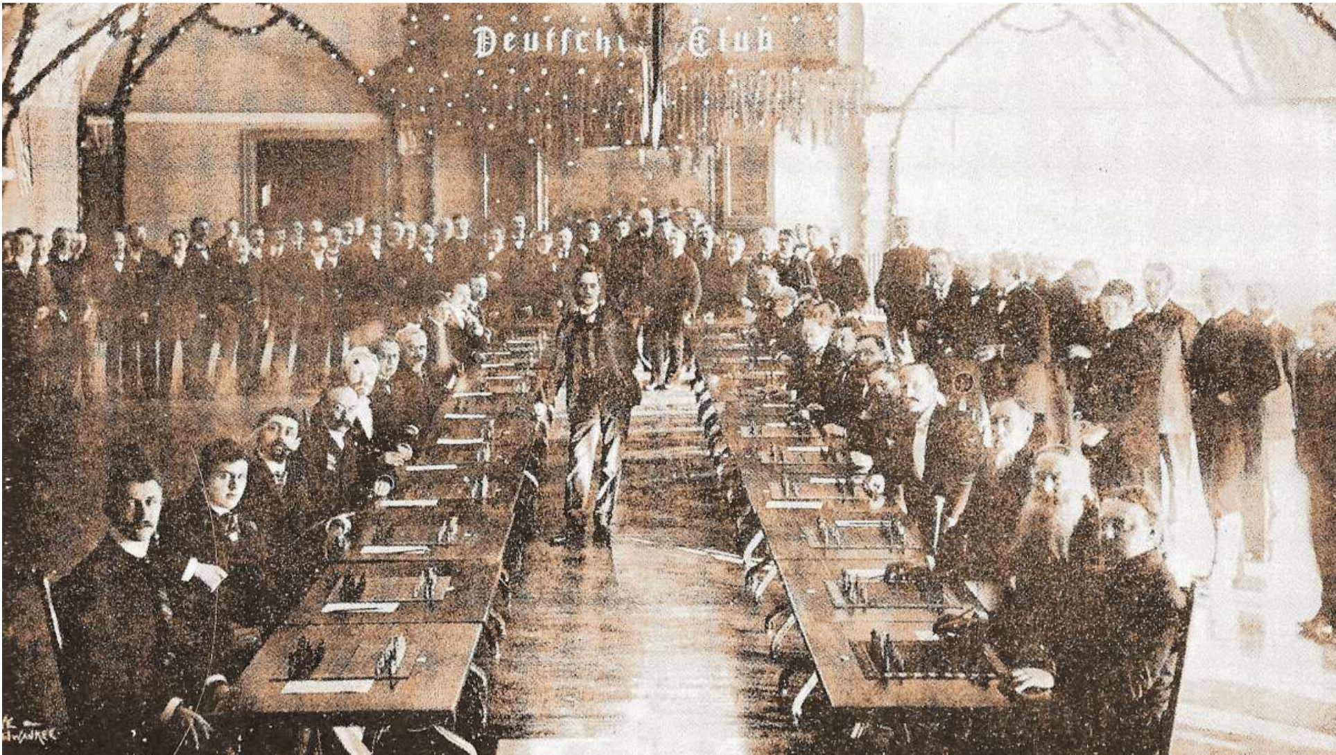
Harry Nelson Pillsbury war ein Phänomen mit einem sagenhaften Gedächtnis, hier beim Simultan-Schach im Deutschen Club in Milwaukee.