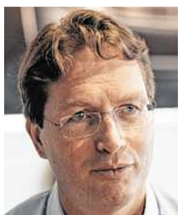
Daimler-Entwicklungsvorstand Ola Källenius sieht für E-Autos einen stark wachsenden Markt – auch in Europa.